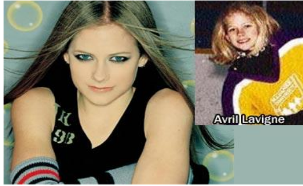
Ca sĩ Avril Lavigne